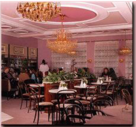
Das Café Lott in Worms, Ende 2011 schloss das Traditionshaus (Archivbild, Quelle: cafe-lott.de).

Kaffee und Bier, das passt nun wirklich nicht zusammen. Wer hätte gedacht, dass ausgerechnet der Sohn einer Wormser Brauerei das wegen bester Back- und Konditoreiwaren sowie seinem Caféhaus-Charme äußerst beliebte Café Lott in der Hafergasse gründete.